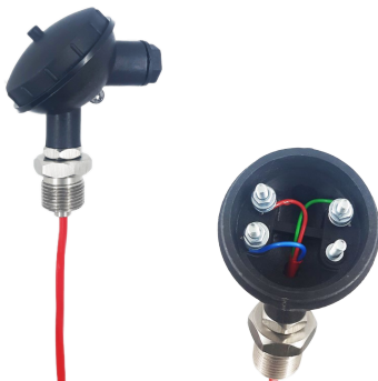
Рисунок 1 – Датчик уровня кондуктометрический трёхэлектродный герметичный ДУ–3Г. Внешний вид