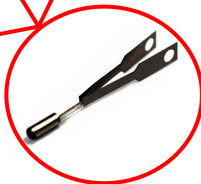
Реле температурное РТ-1