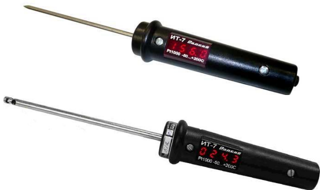
Рисунок 1 – Внешний вид термометра-щупа цифрового ИТ7

2.14 Масса термометра – не более 0,18 кг.