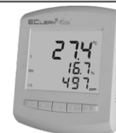
EClerk-Eco-M-RHTC-11 (с ЖК дисплеем)