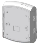
С пластиковым кронштейном

Прибор EClerk-Eco-M без внешнего интерфейса, а также с интерфейсом: WiFi, LoRaWAN, Nb-IOT, Bluetooth поставляется с пластиковым кронштейном. Приборы других модификаций (с проводным интерфейсом) поставляются с металлическим кронштейном.